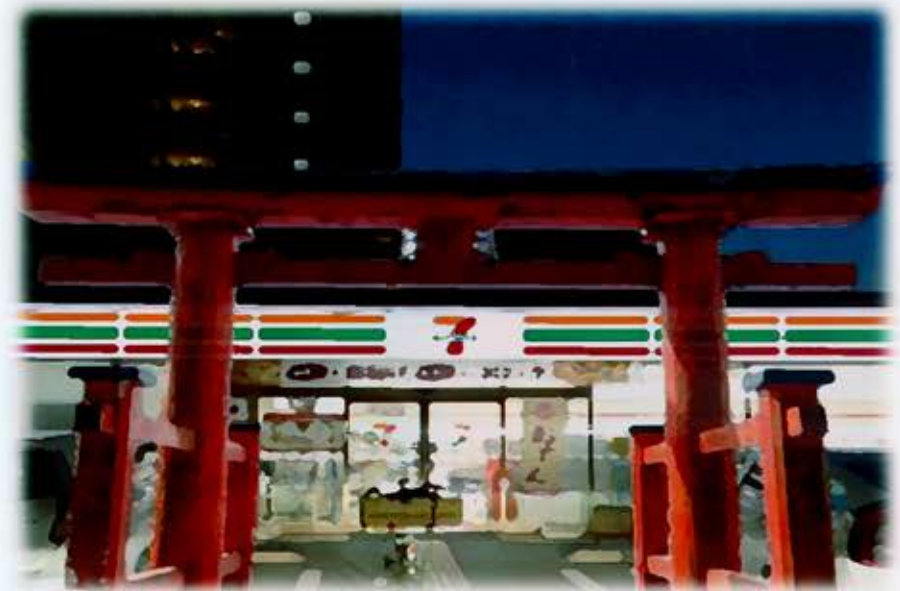
神社をコンビニのような身近な存在に…